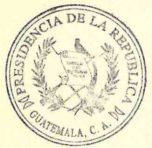
Edgar Leonel Godoy Samayoa MINISTRO DE GOBERNACIÓN